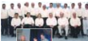
La conférence nationale – Whistler (C.-B.), mai 2002

Les principaux événements sont les suivants :