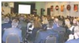
session des membres